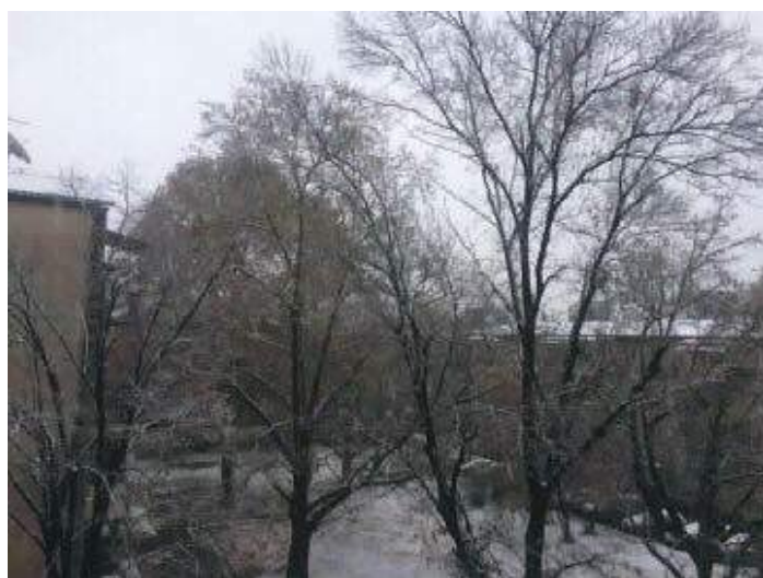
Автор: Олгица Станковска