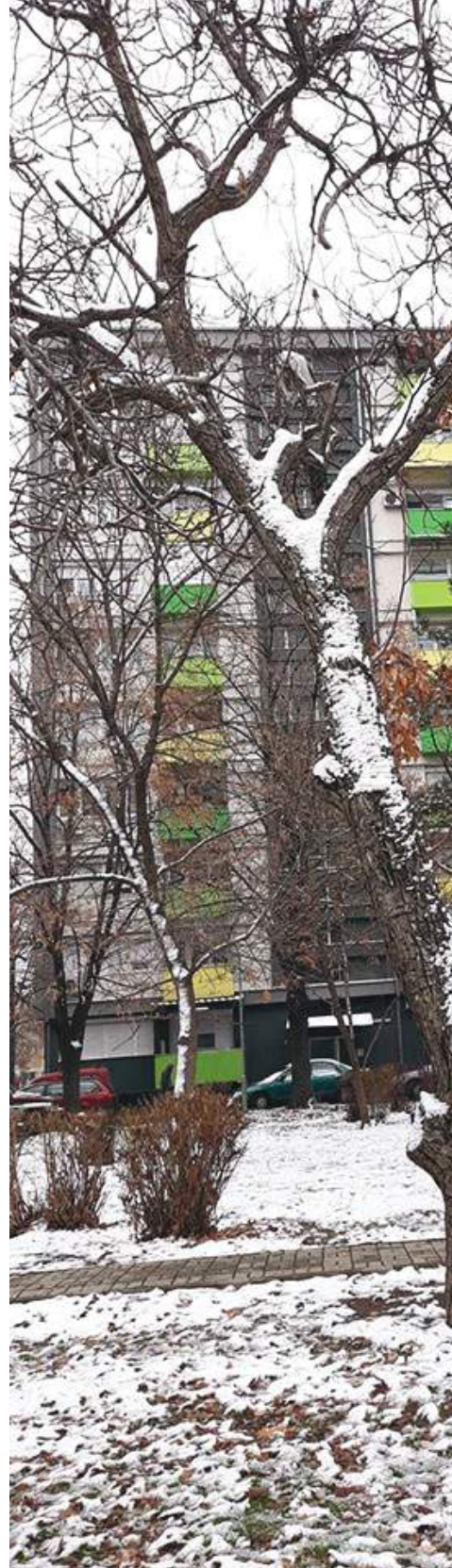
Автор: Горазд Милевски