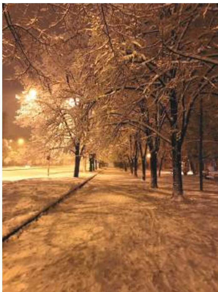
Автор: Џими Каратакис